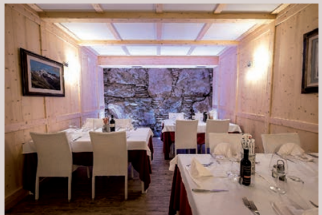
Salette Alta Valtellina