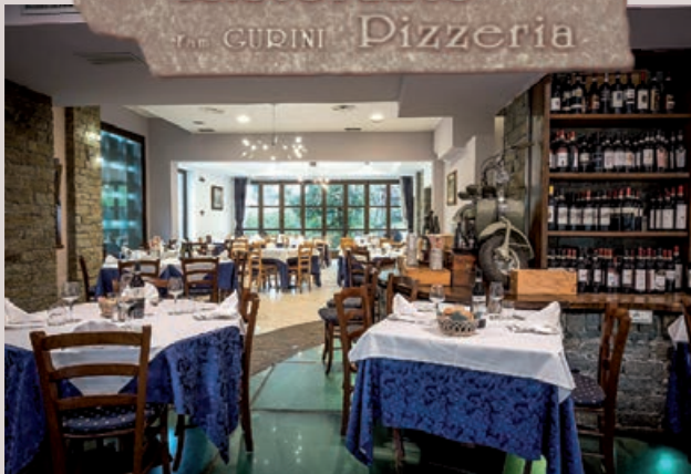
Salone delle Feste