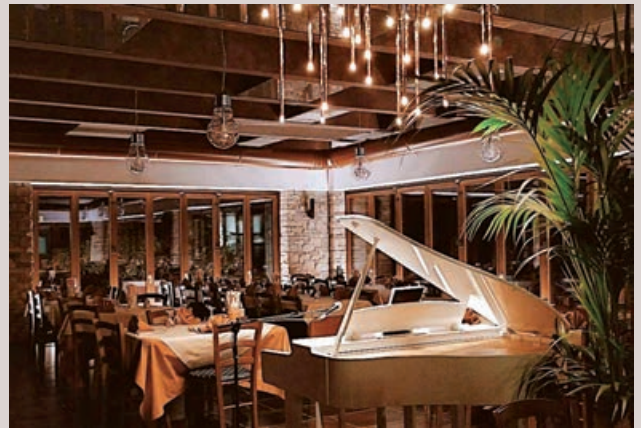
Sala Piano Bar