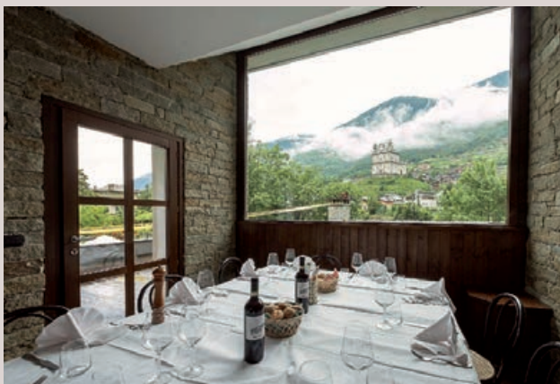
Torretta Santa Casa